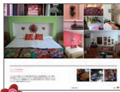
2 小さくて可愛いお宿に泊まる