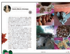
5 アルテサニア(手工芸品)の作り手を訪ねる旅