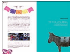
4 サポテコの人びとの暮らし