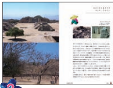
3 郊外の村々を訪ねる